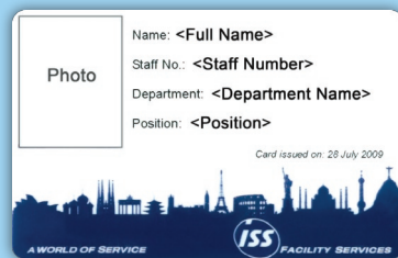
萬匯工作人員證件樣本