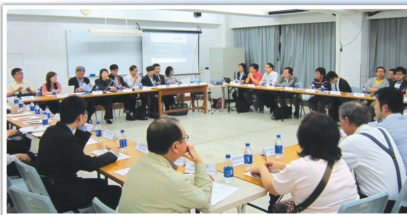
地區人士踴躍參與高鐵香港段社區聯絡小組葵青區首次會議。

港鐵公司在高鐵項目沿綫及相關地區成立了10個社區聯絡小組，定期舉行會議，介紹工程進度，與社區保持緊密的聯繫。