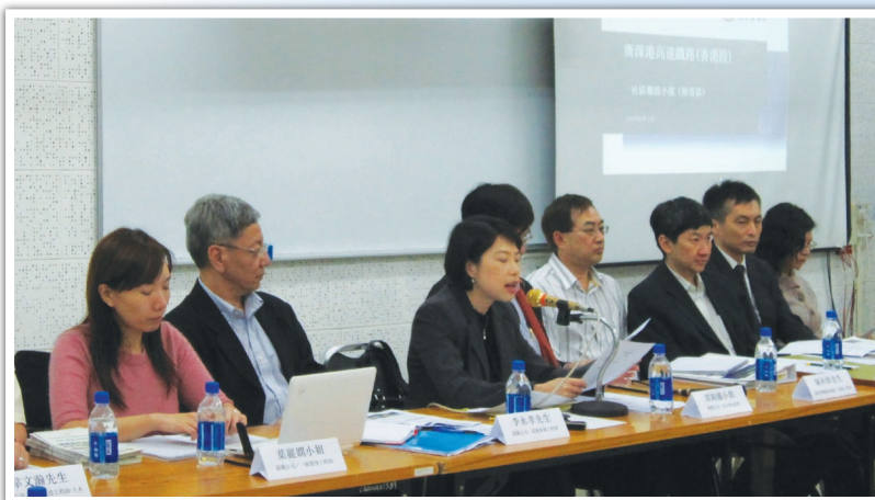
港鐵公司及政府部門代表簡介工程進度，並協調地區人士對工程的關注事項。