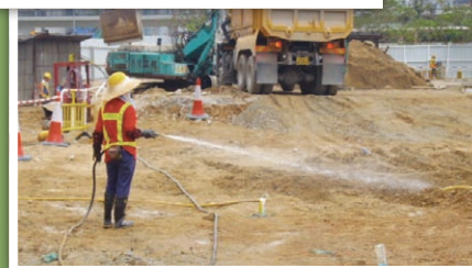
在工地定時灑水以遏止塵埃