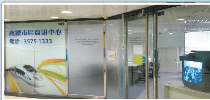
社區大使隊在高鐵資訊中心就項目向居民及公眾提供支援

港鐵公司最近在大角咀區成立社區大使隊，專職透過家訪、面談等方式，就高鐵項目在區內的工程，向相關居民及業戶提供協助及解說。港鐵方面期望大使隊可作為公司與居民間的橋樑，就高鐵工程與區內居民保持更緊密溝通。