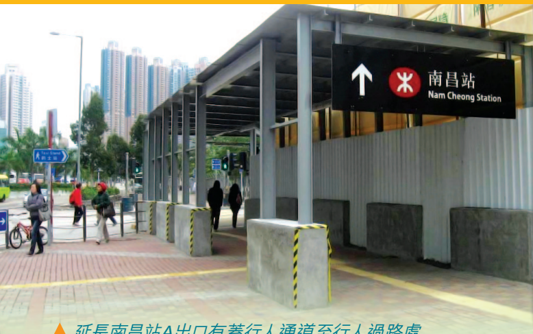
▲ 延長南昌站A出口有蓋行人通道至行人過路處

大型基建項目無可避免會對鄰近社區造成不便，為此，港鐵公司一直就高鐵工程與相關社區人士保持緊密溝通，檢討施工細節並在可行情況下安排合適的緩解措施，以紓緩工程對社區的影響，當中包括：