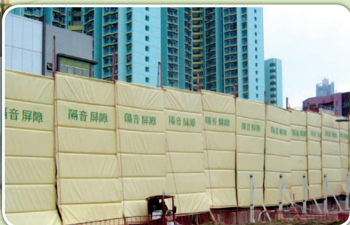
▲ 工程期間裝設隔音屏障以減低聲浪及塵埃