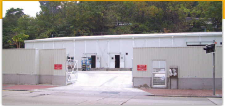
臨時地盤辦公室及訓練中心約會在今年第1季建造完成並啟用。

高鐵項目位於美孚美荔道電力公司變电站旁的臨時停車場，在相關承建商正式上場並檢討工程細節後，決定改為工程支援工地，主要用作存放臨時交通管理計劃所需的物料，以及設立臨時地盤辦公室及訓練中心，不會興建豎井或進行鑽爆工程。有關改動將可大大減少工程對社區的影響。