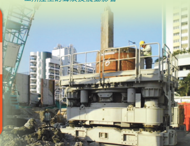
▼ 自日本引入的建築方法及機械有效減少施工所產生的聲浪及震動影響