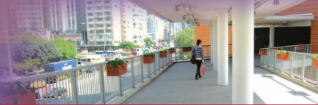
經過綠化的佐敦道行人天橋廣植綠色植物，給人舒適感覺。