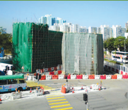
工地範圍以隔音物料覆蓋。

在深旺道現正進行的前期準備工序，包括分階段臨時拆卸位於深旺道與海輝道交界的行人天橋，由於工程期間需要臨時封路，對交通會造成影響，故我們將有關工序安排於午夜後才進行。同時，工程團隊以隔音物料完全覆蓋天橋後才施工，並定時灑水，我們亦以通告預先通知附近居民有關的臨時改道措施，以盡量減免對社區的影響。