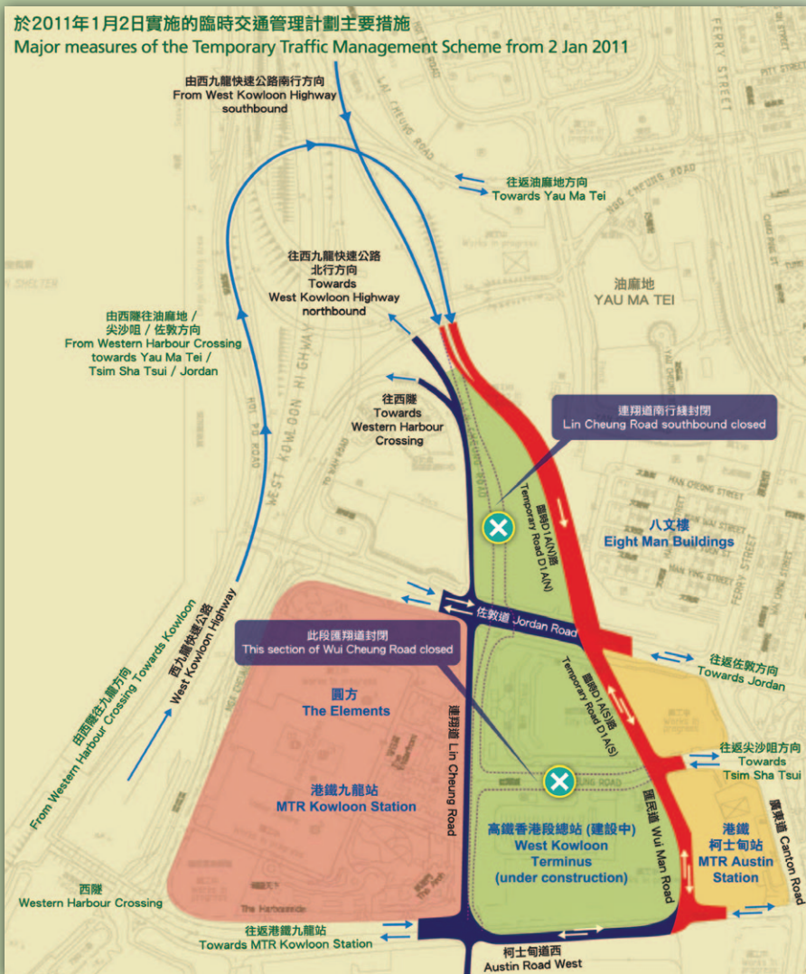
於2011年1月2日實施的臨時交通管理計劃主要措施 Major measures of the Temporary Traffic Management Scheme from 2 Jan 2011