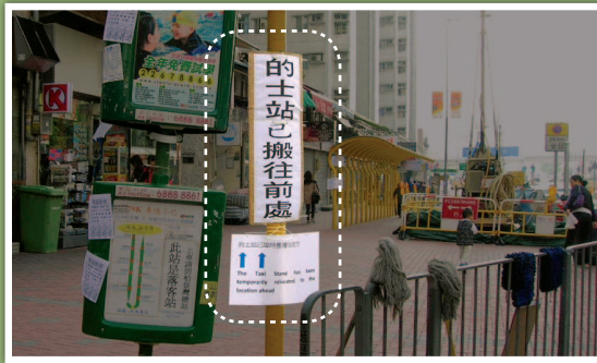
在已遷移之的士站貼上告示提示公眾遷移後的士站的位置。

將工地以圍欄圍起並作覆蓋，才進行施工，以免對居民造成影響。另外，在因為土質鑽探工程而遷移之的士站，除了在現場張貼適當指示外，我們亦向居民派發宣傳單張，通知有關安排。