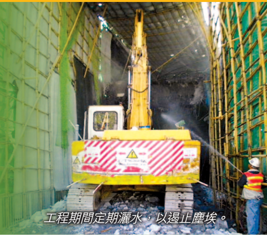
工程期間定期灑水，以遏止塵埃。

在深旺道現正進行的前期準備工序，包括分階段臨時拆卸位於深旺道與海輝道交界的行人天橋，由於工程期間需要臨時封路，對交通會造成影響，故我們將有關工序安排於午夜後才進行。同時，工程團隊以隔音物料完全覆蓋天橋後才施工，並定時灑水，我們亦以通告預先通知附近居民有關的臨時改道措施，以盡量減免對社區的影響。