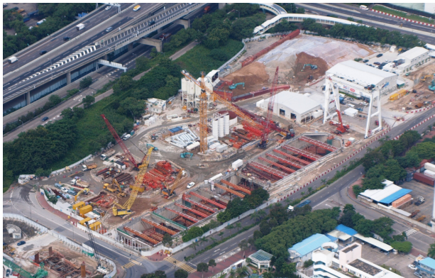
高鐵項目現於深旺道的工地內進行隧道鑽挖機啟動豎井開挖工程，途經大角咀的隧道鑽挖機將由該處出發挖掘隧道。

按高鐵香港段項目的工程進度，市區段的隧道工程鑽挖將在 2012 年第一季開始。政府預計於 2011 年年底前按《鐵路條例》（第 519 章）向相關地段業主發出收回部分地層通知，通知期為 3 個月（由該通知張貼於有關土地或其附近的日期起計）。在通知期屆滿時，有關地層將復歸政府所有，以便隧道工程進行。