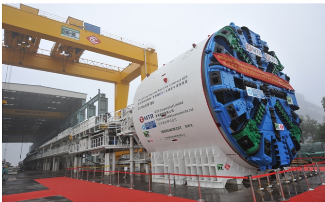
高鐵項目在大角咀區的隧道鑽挖工程將以隧道鑽挖機進行。