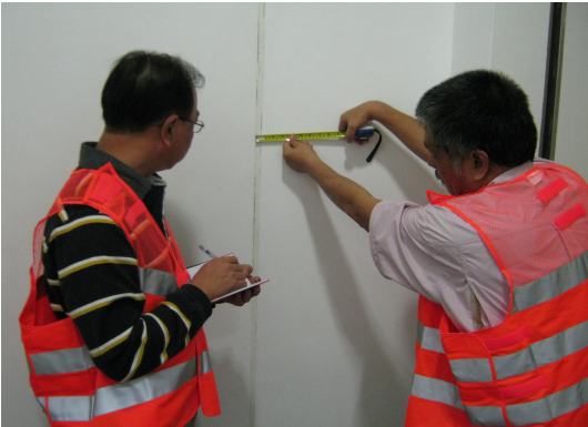
港鐵公司承諾於收到損毀報告的1個工作天內到場查察

若在工程期間，大角咀區內相關樓宇及建築物出現任何因高鐵工程引致的樓宇或路面損毀，港鐵公司承諾於收到損毀報告的1個工作天內到場查察，並於7個工作天內展開相關維修。高鐵工程完成後，如發現樓宇出現擬因高鐵工程而引致的損毀，港鐵公司和路政署亦會繼續跟進。