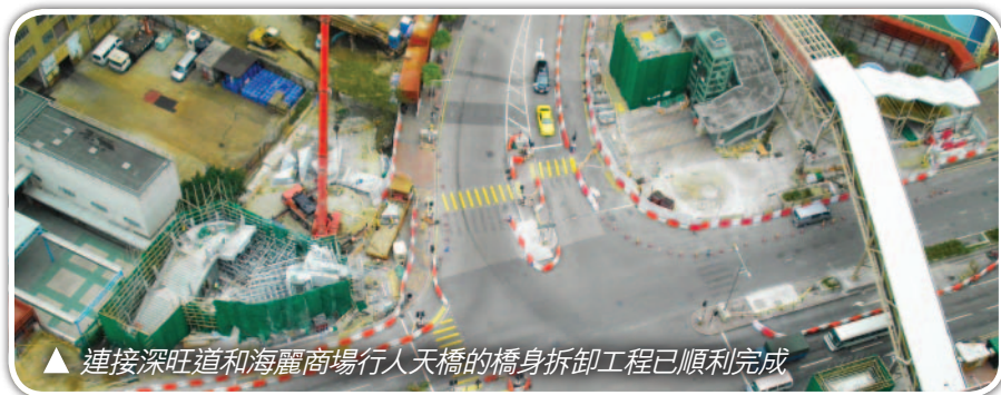
▲ 連接深旺道和海麗商場行人天橋的橋身拆卸工程已順利完成

海麗商場行人天橋的橋身拆卸工程，已於2月順利完成。工程期間，我們的承建商為免工程所產生的噪音影響附近民居，改為以巨型吊機切鋸、分割並遷移橋身，這種施工法較使用機器直接擊碎橋身所產生的噪音少，而對交通的阻礙亦較輕微。