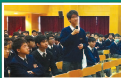
▲ 參與講座同學對高鐵項目使用鑽控機建造隧道的建造方法極感興趣，發問踴躍。