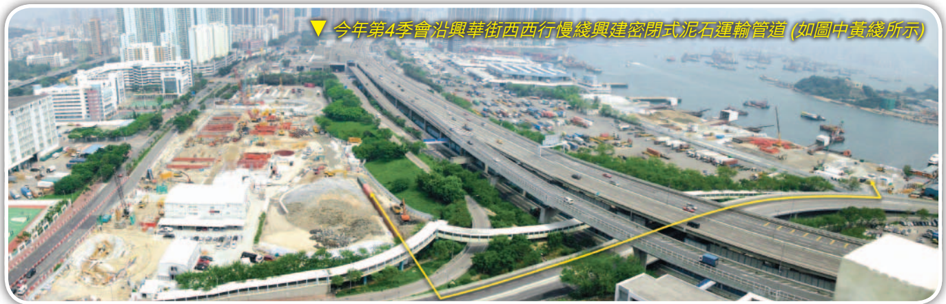
▼ 今年第4季會沿興華街西行慢綫興建密閉式泥石運輸管道 (如圖中黃綫所示)

為減低高鐵工程對深水埗區內交通和環境的影響，港鐵公司會於興華街西行慢綫(如圖示)興建一組密閉式泥石運輸管道，以加壓方式將挖出的泥石從位於深旺道與發祥街西交界的六號地盤運送至南昌躉船轉運站，並經由海路運走。