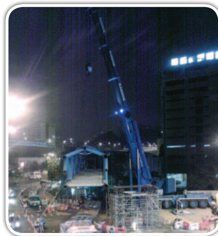
今次以切鋸方式拆橋的工程所使用的吊機為全港其中一座最大型的吊機